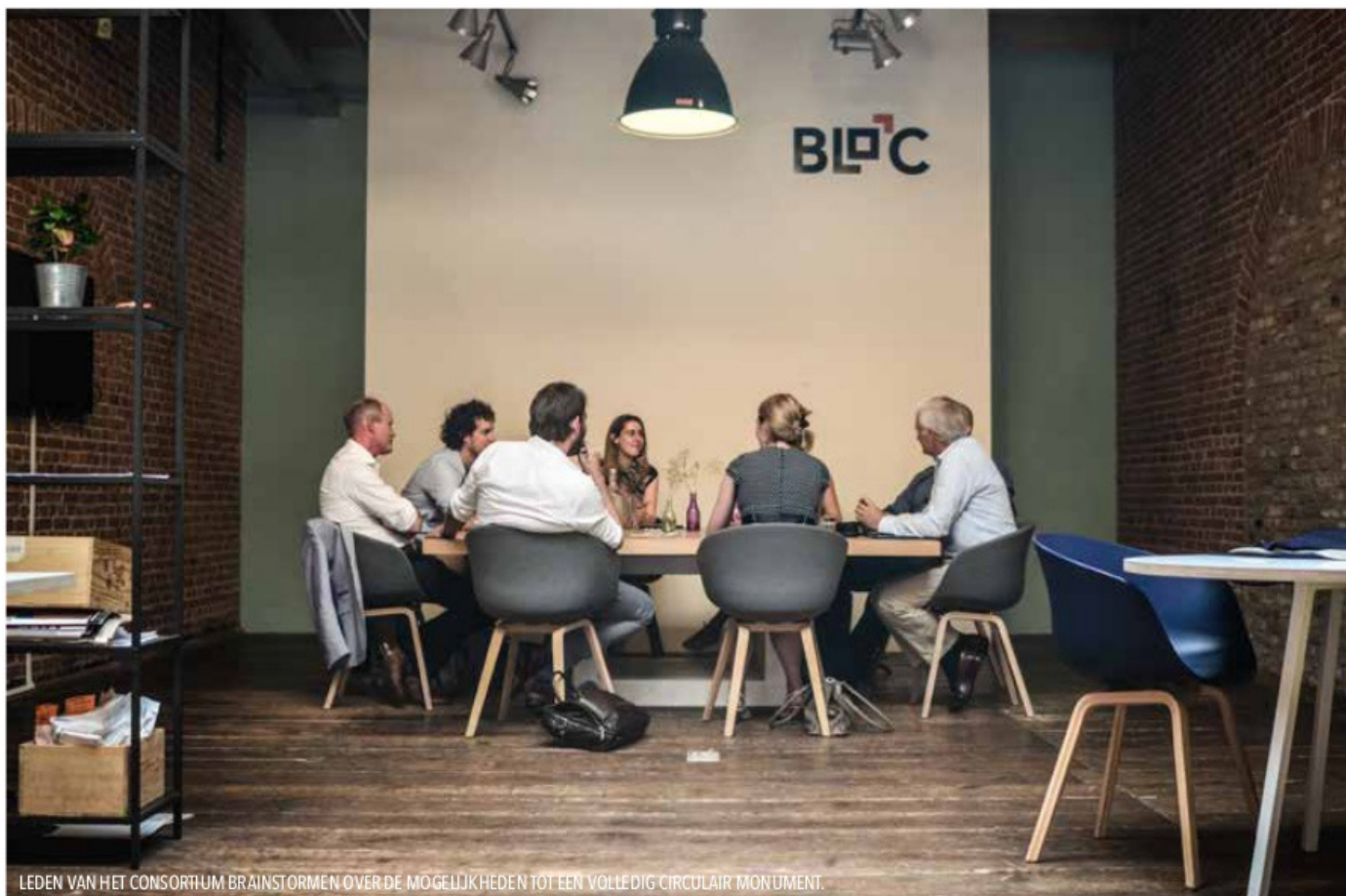
LEDEN VAN HET CONSORTIUM BRAINSTORMEN OVER DE MOGELIJKHEDEN TOT EEN VOLLEDIG CIRCULAIR MONUMENT.

alles meteen op de schop. "Cruciaal is", aldus Oosting, "dat de eigenaar of gebruiker de installaties niet zelf in eigendom krijgt. Er is een leverancier die 'lucht' levert in plaats van luchtbehandelingskasten, distributiekkanalen en inblaas- en afzuigvoorzieningen. Dat bedrijf neemt aan het einde van de levensduur het product terug om dat zo slim mogelijk te hergebruiken en opnieuw in te zetten".